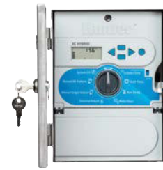
Rozsdamentes Acél Ház magasság: 25 cm szélesség: 19 cm mélység: 11 cm