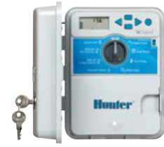
Műanyag Ház magasság: 22 cm szélesség: 18 cm mélység: 10 cm