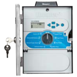
Rozsdamentes Acél Ház Napelemmel magasság: 27 cm szélesség: 19 cm mélység: 11 cm