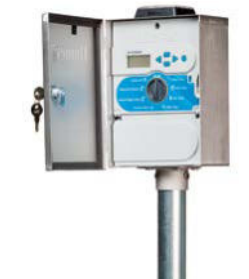
XCHSPOLE Oszlopra szerelhető készlet (választható) magasság 1,2 m