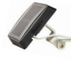
SPXCH Napelem készlet (külön rendelhető) Magasság: 8 cm Hossz: 25 cm Szélesség: 8 cm